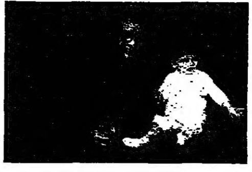
من محفوظات المكتبة المعلوية ، نسي زحلة : الشاعر وحيد